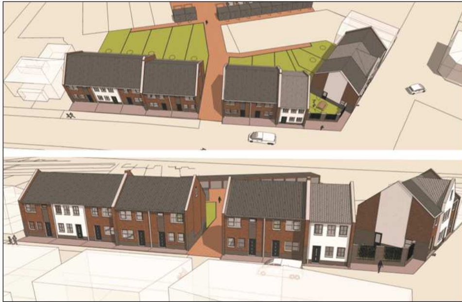
Verbeelding van het wenselijke eindbeeld (bron: Dedem architectuur).

Het concrete voornemen bestaat om alle bebouwing in het plangebied te slopen en elf grondgebonden woningen te bouwen in het plangebied. Op het achter-terrein worden parkeerplaatsen aangelegd. Op onderstaande afbeelding wordt het wenselijke eindbeeld gepresenteerd.