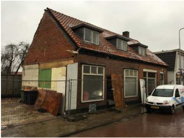
Potentiële broedplaats voor huismus en gierwaluw. Deze soorten kunnen nesten gaan bezetten onder het pannendak.

Het plangebied behoort vermoedelijk tot het functionele leefgebied van verschillende vogelsoorten. Vogels benutten het plangebied als foerageergebied en mogelijk nestelen er vogels in de bomen, struiken, dichte vegetatie op de grond en in gebouwen. Soorten die mogelijk in het plangebied nestelen zijn merel, witte kwikstaart, tjiftjaf, houtduif en Turkse Tortel. Afhankelijk van de aanwezigheid van bebouwing in de broedtijd, kunnen ook soorten als huismus en gierwaluw in het plangebied nestelen. Voor deze soorten vormt de woning met de rode pannen een geschikte nestplaats omdat ze eenvoudig onder de dakpannen kunnen kruipen. De woning wordt niet beschouwd als een bestaande rust- en nestplaats voor huismussen en gierwaluw.