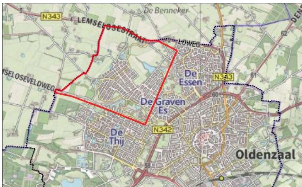
afbeelding 1.1 ligging plangebied