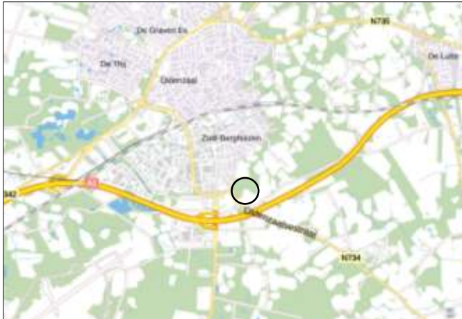
Globale ligging van het plangebied. Deze wordt aangeduid met de cirkel.

Het plangebied is gesitueerd op het adres Postweg 1 te Oldenzaal. Het ligt in het buitengebied, net ten zuidoosten van Oldenzaal. Op onderstaande afbeelding wordt de globale ligging van het plangebied weergegeven op de topografische kaart.