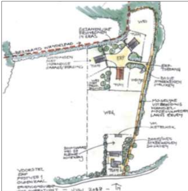
Wenselijke eindbeeld na planrealisatie.

Het concrete voornemen bestaat om drie woningen in het plangebied te bouwen. Ter compensatie van de woningbouw dienen de kassen gesloopt te worden en dient de semi-verharding (grond met worteldoek) verwijderd te worden. Het nieuwe woonerf zal ontsloten worden via een nieuw aan te leggen erftoegangsweg langs de oostzijde van het plangebied. Het deel van het plangebied, dat buiten het nieuwe erf ligt, wordt ingericht als agrarische cultuurgrond (weide). Op onderstaande afbeelding wordt het wenselijke eindbeeld weergegeven.