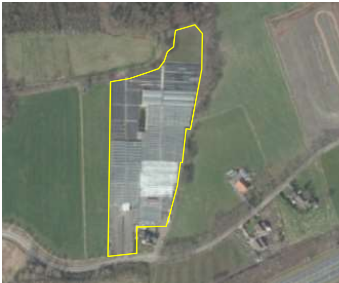
Detailopname van het plangebied. De begrenzing van het plangebied wordt met de gele lijn aangeduid.

Het plangebied vormt een bedrijfslocatie waarop een vaste plantenkwekerij is gevestigd. Het plangebied bestaat grotendeels uit bebouwing (kassen), grond met worteldoek en voor een klein deel uit grasland met een agrarisch gebruik. Dit grasland wordt jaarlijks gemaaid, waarbij het maaisel wordt afgevoerd. Het plangebied ligt in het buitengebied en grenst aan de westzijde aan agrarisch cultuurland, aan de oostzijde deels aan een houtsingel en deels aan agrarisch cultuurland en aan de noordzijde aan bos. Op onderstaande luchtfoto wordt de ligging en begrenzing van het plangebied weergegeven.