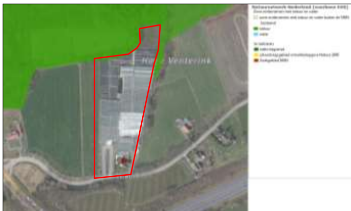
Ligging van Natuurnetwerk Nederland in de omgeving van het plangebied. Gronden die tot het Natuurnetwerk Nederland behoren worden met de (egaal) donkergroene kleur op de kaart aangeduid. Het plangebied wordt met de rode contour aangeduid.

Het plangebied ligt buiten het Natuurnetwerk Nederland, maar grenst aan de noordzijde wel aan gronden die tot het Natuurnetwerk Nederland behoren. Op onderstaande afbeelding wordt de ligging van het Natuurnetwerk Nederland in de omgeving van het plangebied weergegeven.