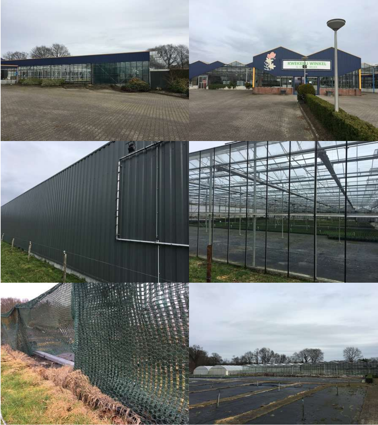
Bijlage 2. Fotobijlage. Impressie van het plangebied en de directe omgeving.